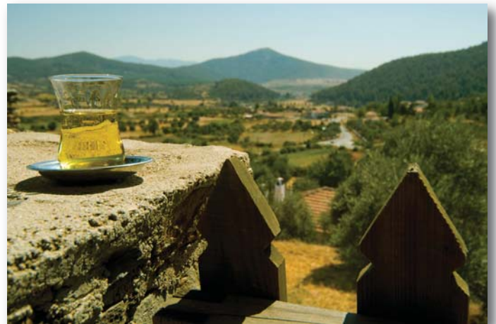
Fotoğraf 1: Belen Kahvesi'nden ovaya bakış (dağ çayı eşliğinde...)