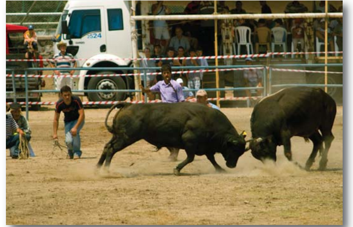
Fotoğraf 7: Boğa güreşi sırasında hakemler, boğa sahibi ve bakıcısı çömeliyorlar ve seyircilerin rahat izlemesini sağlıyorlar.

Sahada her boğa ile birlikte normalde sadece iki kişi olabiliyor: Boğanın sahibi ve bakıcısı... Güreşi hakemler, boğanın bakıcısı ve sahibi yere çömelerek izliyorlar, böylece seyirciler de güreşi rahat izleyebiliyorlar.