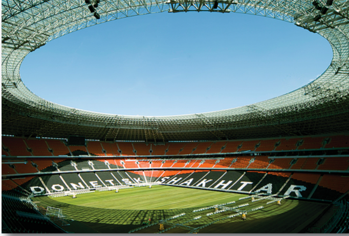
Fotoğraf 9: Üstü kapalı olan statlarda oluşan çimlere ulaşan gün ışığı eksikliği

Biraz da çim sahanın özelliklerinden bahsedelim. Üstü kapalı olan statlarda çimlere yeterince gün ışığı gelmediği için çimlerin büyümemesi, hatta hava dolaşımı da az olduğu için de ölme problemleri varmış. Hava dolaşımının az olması sahaya ve çimlere yaratılan suni bir hava akımı ile egale edilmiş.