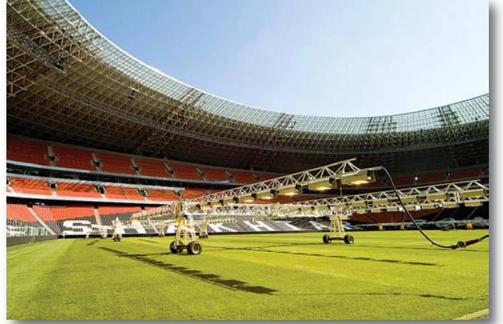
Fotoğraf 10: Güneşini taklit eden ışık kaynağı çimlerin üzerinde saatlerce duruyor.

Bu suni kaynakların çalışırken olan görünümünü fotoğraflarda izleyebilirsiniz. Bu kaynaklar çimlerin hızlı büyümesini sağlıyormuş. Ancak bu yapay gün ışığı kaynaklarının bilinen problemlerinden biri, kökün çimin toprak dışındaki bölümü kadar hızlı büyümemesi imiş. Yakın bir zamanda bu probleme de bir çözüm bulunacaktır.