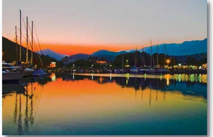
Fotoğraf 3: Posterizasyon tekniği uygulanmış günbatımı fotoğrafı (Palamutbükü)